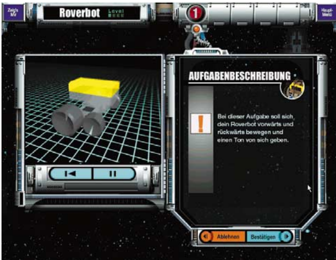
Bild 5. In der Programmopädia werden einige Robotermodelle vorgestellt ...