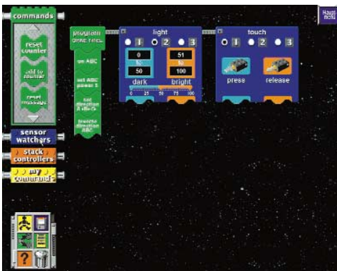
Bild 3. Die Entwicklungsumgebung erinnert an ein Puzzle.