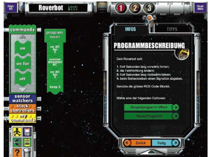
Bild 6. ... und beispielhaft programmiert.

runssystem losgehen. Das Verfahren klingt umständlich, eröffnet aber die Möglichkeit, die alte Steuerungssoftware durch zukünftige Updates auf den neusten Stand zu bringen. So unterstützt die aktuelle Variante 1.5 einen Rotations-, einen Temperatur- sowie weitere Sensoren, die (noch) nicht zum Grundpaket gehören.