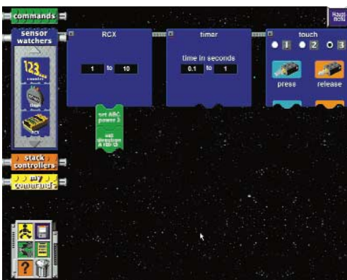
Bild 4. So werden die Sensoren eingestellt.

zuletzt aufgrund der Zusammenarbeit mit dem Media Lab des Massachusetts Institute of Technology (MIT) als äußerst gelungen bezeichnen. Die auch bei einem älteren Pentium problemlos verlaufende Installation der CD-ROM benötigt satte 70 MB Festplattenspeicher in der Grund- und 140 MB in der Vollversion. Dafür erhält der Anwender