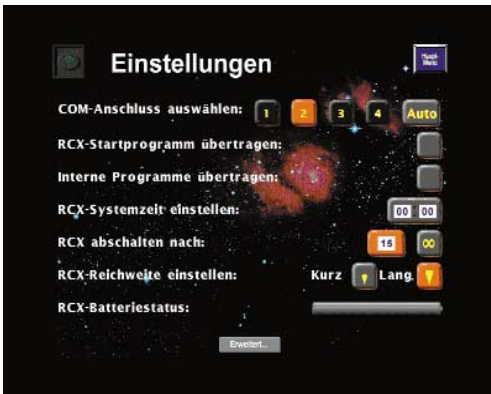
Bild 2. Systemeinstellungen in der grafischen MindStorms-Software.