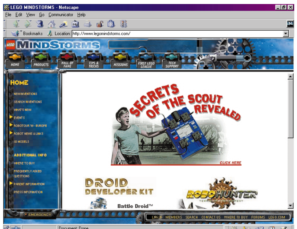
Bild 7. Internetunterstützung erfährt der MindStormer über ein eigenes Portal mit allerlei Infos, FAQs, einem Download-Bereich und viel Platz zum Chatten.